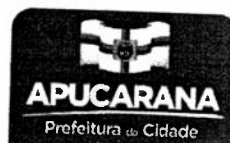
TABELA DE VALORES – CARGOS DE PROVIMENTO EM COMISSAO

CEP 86.800-280 | APUCARANA - PR | www.apucarana.pr.gov.br